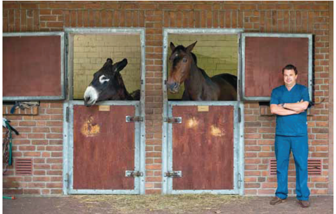
Der Pferdedoktor und seine Patienten, zu denen auch Esel zählen können.

Waren zu Zeiten aktiver Landwirtschaft vorwiegend die im Volksmund als Ackergaul bezeichneten Arbeitspferde Patienten beim Tierarzt, sind es nun meistens wertvolle Springpferde aus den mondänen Kreisen, die bei Cronau auf dem OP-Tisch landen. „Viele Turnierpferde, die hier behandelt werden, weisen